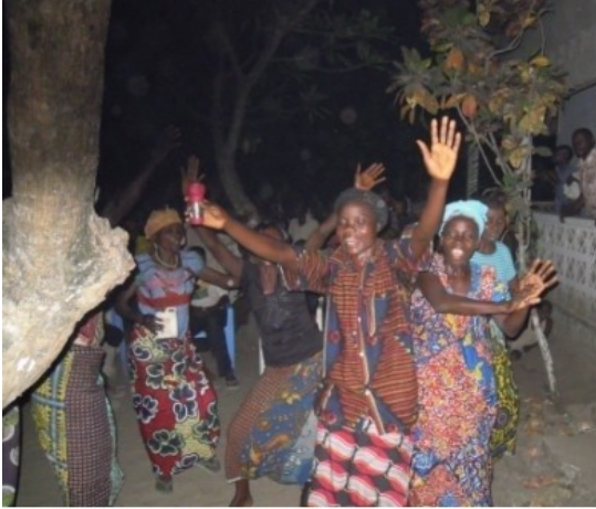
nachtelijk welkom in Bagata

De reis nam meer dan 12 uur in beslag, over een zandweg vanuit de provinciehoofdstad Bandundu-ville. Dooreen geschud en gaar kwa-