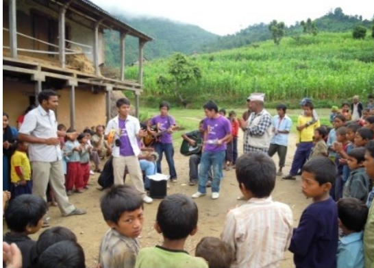
openlucht bijeenkomst in Gogane