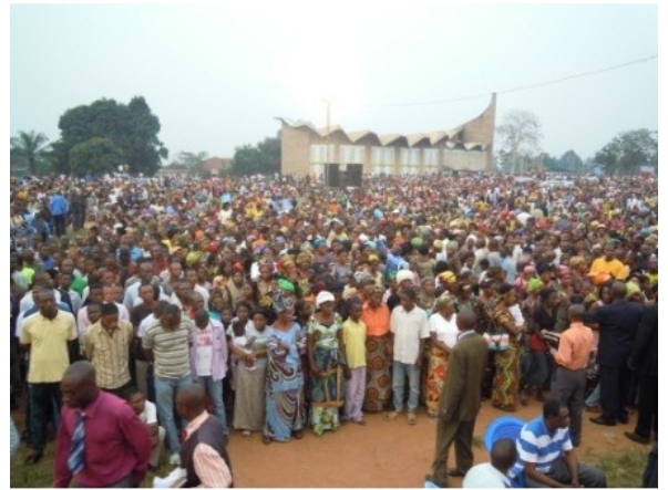
Massabijeenkomst in Mbuji Mayi

In Mbuji Mayi (Dem. Rep. Congo) kwamen tienduizenden naar de evangelisatiebijeenkomsten. Onder hen was de gouverneur van de provincie Oost-Kasaï (11 miljoen inw.) De laatste dag van de driedaagse kwamen er minstens 15.000 bezoekers. Vele duizenden gaven te kennen dat ze Christus wilden volgen (2100). De samenwerking met de kerken in die grote plaats (1 miljoen inwoners) liep voortreffelijk, vooral met de echt Afrikaanse kerk (niet door de zending gesticht) die ons ontving: de Evangelische Kerk van de Getuigen van Christus, een genootschap met 600.000 of meer leden.