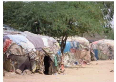
de bults, woningen voor de armen