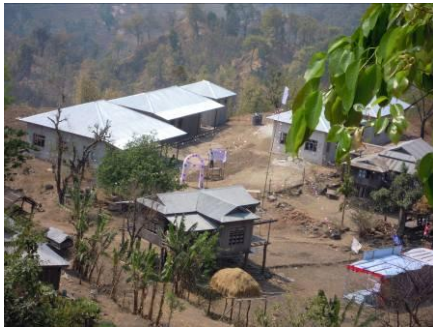
Ziekenhuiscomplex in Larumba

In Balamvita, in de vlakte van Oost-Nepal, hebben we een schooltje laten bouwen. Dat kwam omdat de kindertjes van de Santali's (kastelozen) geweigerd werden op de staatsschool. Eén kerk in het bijzonder heeft hier aan gewerkt. Nu kunnen 36 Santalikinderen onderwijs