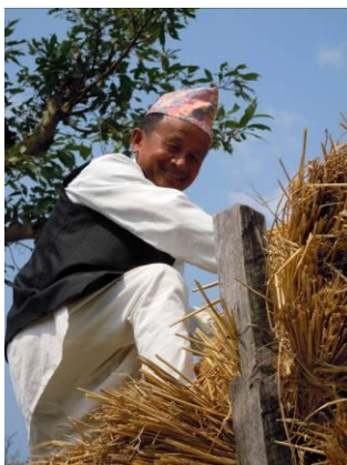
Kiritiman in klederdracht

NIEUW: Dynamiek in uw gesprek . € 8,50 en Dynamiek in uw preek . € 10,00