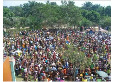
Samenkomst met 10.000 bezoekers in Mbuji Mayi (zomer 2010)