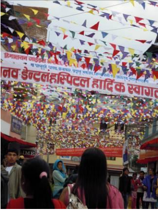
Het bergstadje Taplejung (Nepal, waar we een conferentie hadden) in feesstemming.