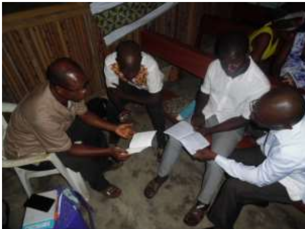
Bijbelgroep in Adiaké, Ivoorkust

Er staan magere jaren te wachten, misschien wel 7 magere jaren zoals onder Jozef in Egypte. Maar ons werk is vooral op projecten gericht. Bovendien hebben we internationaal honderden en honderden nazorggroepen op de been geholpen. Doordat de kerken overal waar we werken hun deuren moesten sluiten, ziet opeens iedereen het belang in van kleine groepen – en dat resulteert in tientallen aanvragen voor cursussen en trainingen. Voorlopig kunnen we nog goed vooruit.